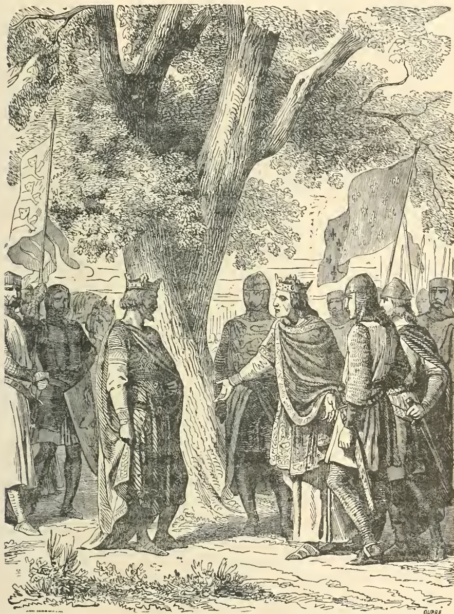
Entrevue de Henri II et de Philippe à Gisors.

pagne en s'attaquant aux riches abbés et aux évêques du pays, dont la plupart, suivant l'esprit de leur ordre, soutenaient la cause du pouvoir établi. Ils pillaient leurs domaines, ou, les arrêtant sur les